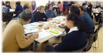
社協でも毎年検討しています!