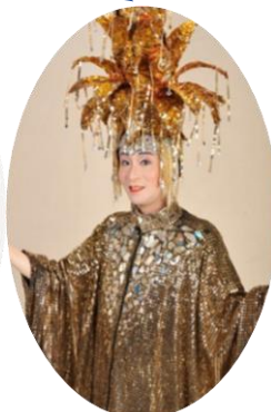
まりもちゃん (ものまねショー)