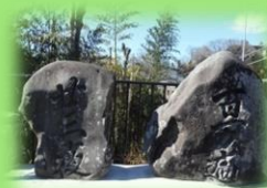
橋のたもとの石碑