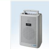
ワイヤレスアンプ

取付けて伸ばすだけ!あらゆるシーンに対応するワンタッチテント ワンタッチテント サイズは 2.4m×3.6m