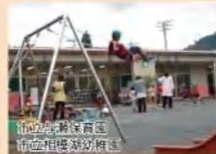
市立相模湖保育園 市立相模湖幼稚園