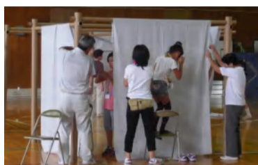
避難所間仕切りシステム