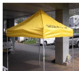
かんたんテント 2.4m×2.4m 12張 3.0m×3.0m 2張