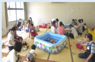
子育てサロン夢♡民の様子