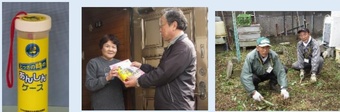
あんしんケースの配布