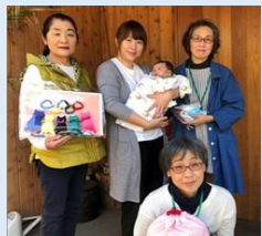
ぬくもりプレゼント 300人目の赤ちゃん訪問