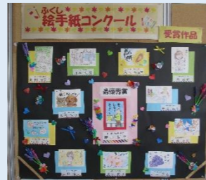
令和2年度ふくし絵手紙コンクール受賞作品