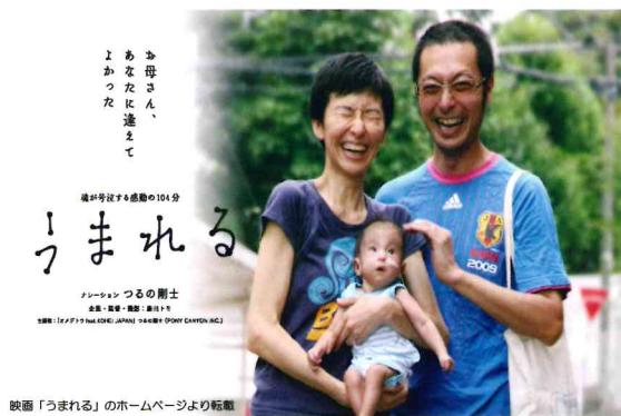
映画「うまれる」のホームページより転載