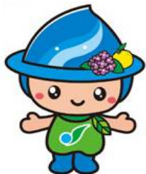
相模原市マスコットキャラクター さがみん