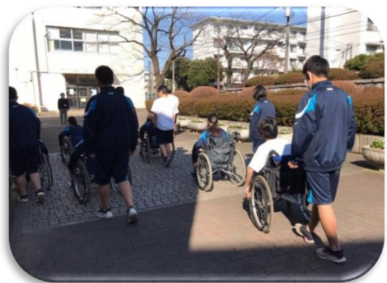
校舎やなじみの場所で体験することで他人事ではなく“自分事”として考える。