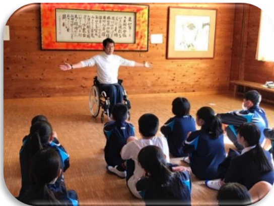
肢体に障がいのある当事者からの講話。 「すべての人が暮らしやすい社会」とは