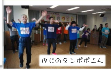
いじのタンポポさん