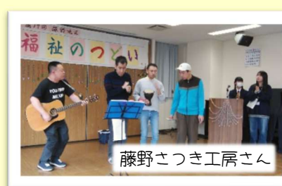
藤野さつき工房さん

中学生ボランティアの皆さんが、ステージ発表の司会、着ぐるみなどで「福祉のつどい」を盛り上げてくださいました！