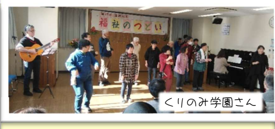
くりのみ学園さん