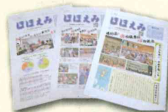
広報紙「ほほえみ」年3回発行しています。