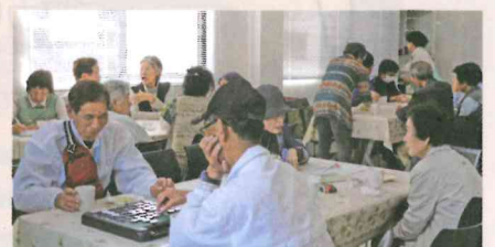
おしゃべりしたり、ゲームをしたり、みんな自由にすごしています! 100円持って遊びにきませんか?

日 時：毎月 第3水曜日 13:00～16:00 場 所：小山公民館コミュニティ室 参加費：100円(茶菓代)※予約は不要です。