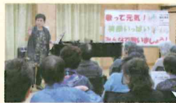
【福祉講座】福祉に関するさまざまな講座を開催します。