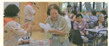
ビンゴ大会で豪華賞品をゲット！