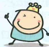
市社協 マスコットキャラクター にこまる