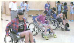
【ジュニアボランティアスクール】夏休みの思い出に参加してみよう？