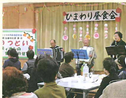
懐かしい歌をみんなで楽しく歌いました！