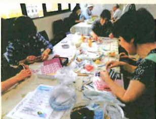
みんなでコースター作りをしました！