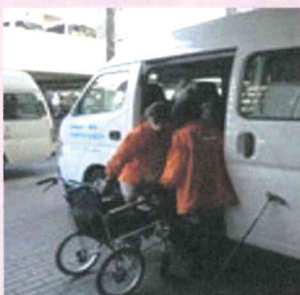
車両へ乗り入れのお手伝い