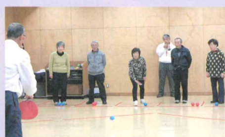
中央区連絡会の会員研修② 講義終了後のゲーム体験