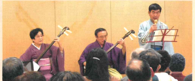
「りんごの会」心に沁みだした歌声を披露

そしてその後、太鼓と津軽三味線に持ち替えて演奏を始めた津軽おはら節、津軽じょんがら節の高度なテクニックに、今度は会場中がその演奏に魅了され、惜しみない拍手が鳴り止みませんでした。