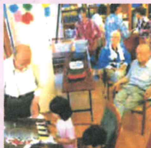
ゲーム大会でのお手伝い