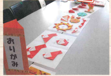
こんな形も作れます

平成30年11月17日(土)当日はお天気にも恵まれ、とても過しやすい陽気の中「第31回 ふれあいのつどい」が小山公民館にて開催されました。大会議室では、やすらぎ一座によるお芝居や介護用品Q&A、ポッチャゲーム体験が行われました。また、屋外では野菜販売や模擬店、折り紙やクリスマスカードなどの工作コーナー、そして「きらくクラブ」のお食事処や、コーヒーを楽しむ「ほっと