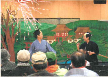
大道具に凝っています