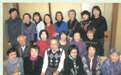
月一回の定例会にて (31年1月)