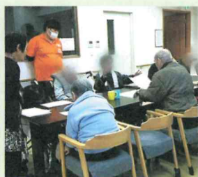
歌うたいのお手伝い (元氣村相模原)