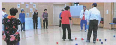
「ふれあいのつどい」にて

現在ボッチャボランティアメンバーは8名です。みんな楽しく、参加者と交流しながら活動しています。あなたも仲間に入りませんか?メンバー一同お待ちしております。