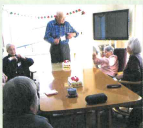
行事日程の説明をしました! (デイサービスかりんとう)