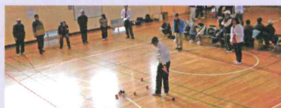
白熱したボッチャ大会