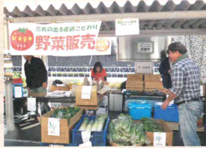
新鮮な野菜がたくさん！