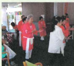
夏祭りのお手伝い (ユノトレメゾンさがみ)