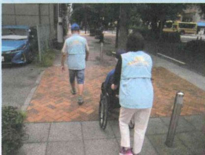
車いすを押して、行きつけの床屋さんへ