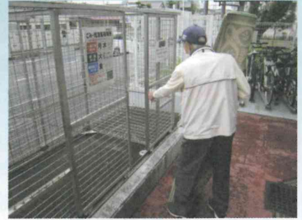
粗大ゴミ搬出のお手伝い

可能な限り自分のことは自分で対応した上で、それでも自分で対応できなくなり、頼れる家族などもない時には助けを求めよう。誰もがいずれ「助けられる人」になっていい。