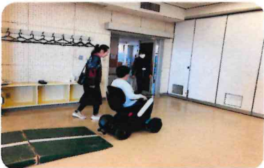
電動車イス体験 「おもしろかった」「思ったより動かしやすかった」と好評でした