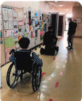
車イスで扉を出入りし、廊下を走ってみました