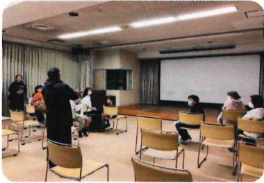
「きまりのないくに」映画上映 16ミリ映写機による上映でした