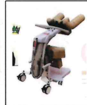
補助具もいろいろ