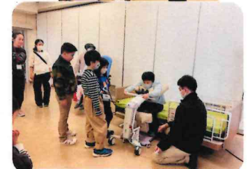
体に力の入らない人の移動を助けてくれるリフトを使って、電動ベッドから起き上がる体験をしました