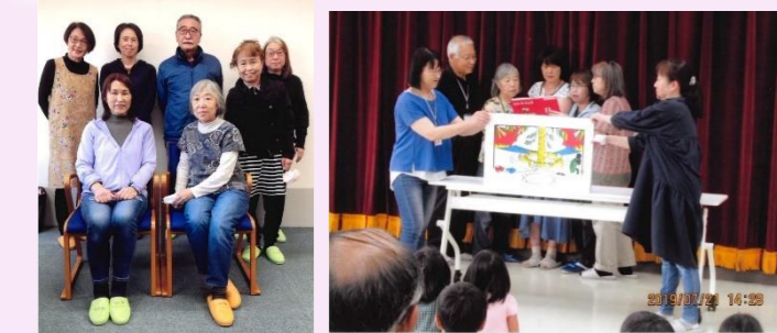
メンバー集合写真 どんぐり文庫で読み聞かせ

おはなしクレヨンは、旧相模湖町内を中心に、保育園、こども園、小学校などへ行って、絵本や紙芝居などの読み聞かせを行っているグループです。