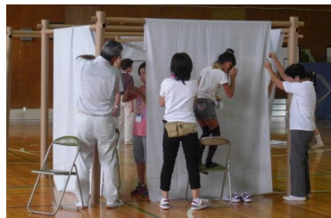
避難所間仕切りシステム