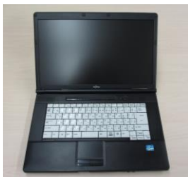
ノートパソコン (ウィンドウズ)