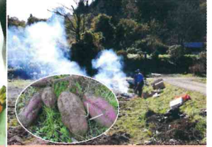
10・11月さつまいもを焼いて