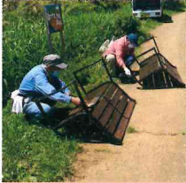
6月ベンチのベンキ塗り

*野菜の生育状況によって、追加や活動日の変更があるので、参加を希望される方は、☎783-1212 にご連絡ください。