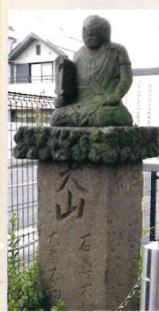
不動明王座像の道標