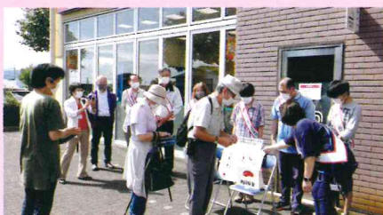
スーパーアルプス城山店

10月1日に予定していた街頭募金は、荒天の為中止になりましたが、8日にスーパーアルプス城山店とAコープ城山店にて、「つくしの家」「薫風」他の皆様のご協力、募金活動を実施しました。