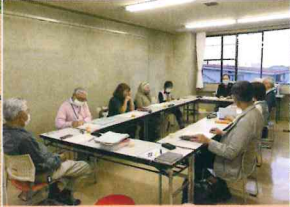
月に一度のコーディネーター会議