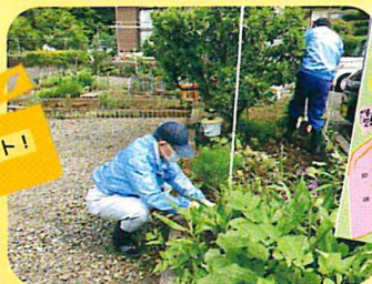
あい♡あいセンター