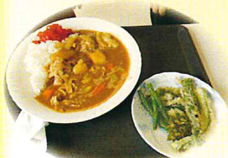
愛・城ものがたり再開に向け企画中!