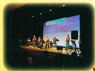
福祉のつどい企画中! (写真は2019年11月)