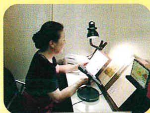
朗読サービス あけびの会