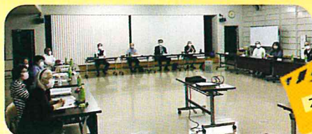
4月27日理事会にてどんな動画を撮るか話し合い…