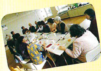
家族を支える会 ほっと