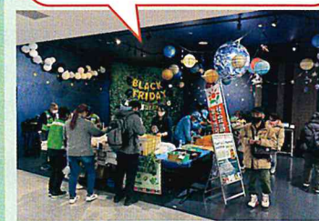
ブラックフライデーで大忙しの社員さんが足をとめて…お買い物！

「農福連携」に取りくむ団体の交流や情報交換を行なう場面もあり、貴重な機会となりました。