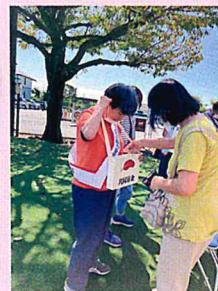
スーパーアルプス城山店

また、各自治会を通して地域の皆さんから、そして地区内の幼稚園、小中学校、高校、保護者、教員の皆さんのご協力によりたくさんの募金が集まりました。