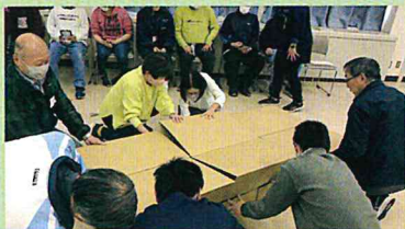
4チームに分かれて、段ボールベッドの組立…「この端はどこにいれる?」