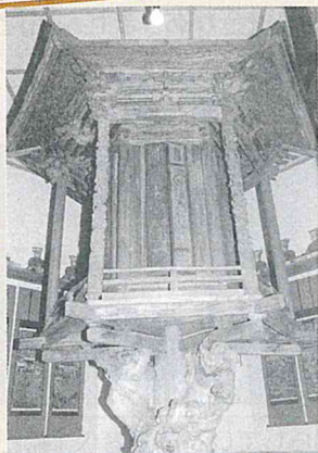
経堂内の輪蔵(一切経を納める)