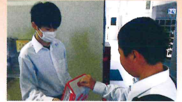
相模丘中学校生徒さんによる校内募金活動(赤い羽根共同募金)

城山地区社会福祉協議会が支援する自治会やボランティア、高齢者サロンなどの地域の福祉活動の財源は、城山地区の店舗・事業所、広く地域の皆様のご協力による愛の募金(箱)やご寄付、また自治会に尽力いただている共同募金や賛助会費等に支えられています。今年度、城山地区の皆様から寄せられた募金等の結果をご報告します。