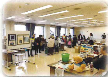
中学生ボランティア 大活躍

中学生ボランティアがパンダの着ぐるみを着て、会場内の各コーナーをPR。来場した子どもたちの人気を集めていました。