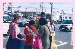
「城山薫風」の皆さんも街頭募金に協力

お寄せいただいた募金は、神奈川県共同募金会に納めた後、神奈川県全体と相模原市社会福祉協議会、また城山地区社協の活動財源として活用されます。