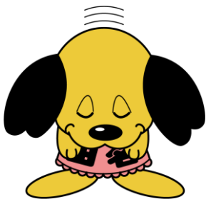
イメージキャラクター「たなワン」