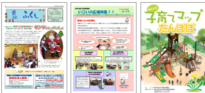
東林ふくしまつり