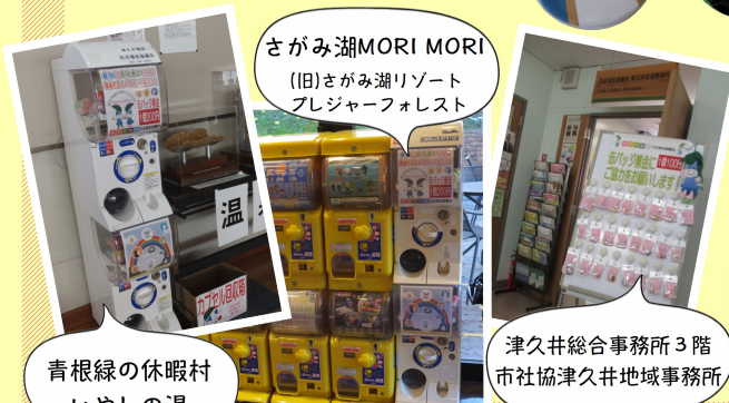
青根緑の休暇村 いやし湯