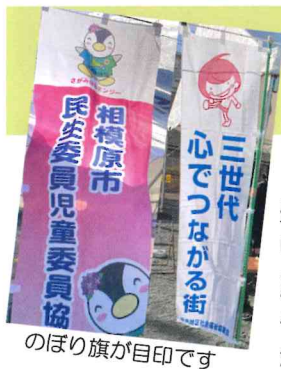
のほり旗が目印です

各団体のダンスや演奏も熱気に満ち、模擬店も沢山の人が大賑わい。地域一丸となって楽しんだ「ふるさとまつり」となりました。(鈴木)