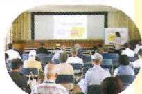
研修参加者のコメント(一部)

8月に実施した会員向け研修会は、「社協とは？」をテーマに開催しました。研修を生かして、今後大野中地域全体に活動が浸透するよう取り組んでいきます!!