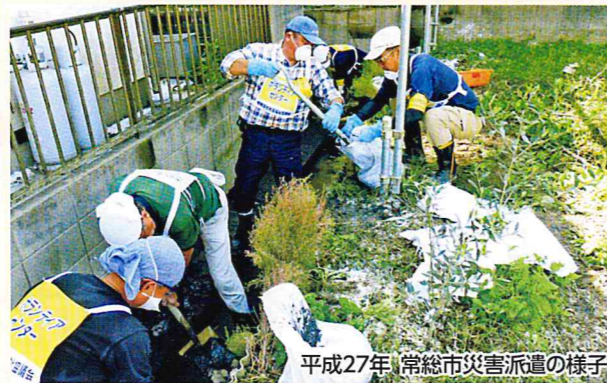
平成27年、常総市災害派遣の様子